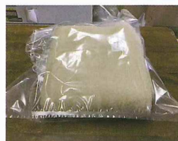
① 24折した毛布を封入