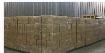
④ 備蓄倉庫に納品・長期保管